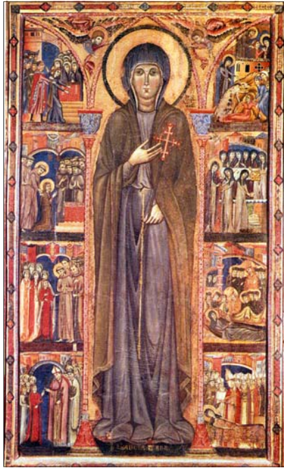
Sainte Claire, scènes de sa vie Assise, Basilique Sta Chiara, 1283,

Va tranquille et en paix, ô mon âme bénie, car tu as un bon guide sur la route.