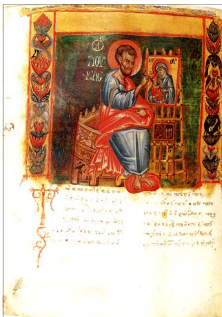
Saint Luc peint la Mère de Dieu, Lectionnaire byzantin, Monastère Ste Catherine, 14 e -15 e s.

La Fraternité des douze Apôtres célèbre la Divine Liturgie (messe, de rite byzantin, en langue française) tous les samedis à 18h00 à "Cana" (rue Eggericx, 16 - Woluwé-St-Pierre) sauf en juillet et août et exception annoncée à l'agenda.