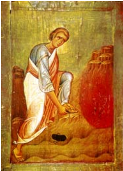
Moïse au Buisson Ardent, monastère ste Catherine, 12 e S

Par la création jusqu'au Créateur : dans et à travers le buisson qu'il contemple, Moïse entre en communion avec le Dieu vivant. Mais ce n'est pas tout. Selon l'interprétation adoptée par l'Église orthodoxe, la rencontre personnelle doit être comprise en des termes plus spécifiques. Moïse rencontre non seulement Dieu, mais le Christ. Toutes les théophanies de l'Ancien Testament sont des manifestations non pas de Dieu le Père, que nul n'a jamais vu (Jn 1, 18), mais du Christ pré-incarné, Dieu le Logos éternel.