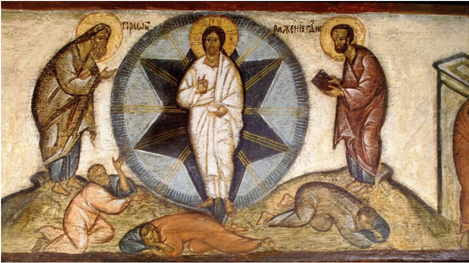
Transfiguration, église des Trois Sts Hiérarques, Paris, 20e s.

Tu t'es transfiguré sur la montagne ô Christ notre Dieu laissant tes disciples contempler ta gloire autant qu'ils le pouvaient. Par la prière de la Mère de Dieu, fais briller aussi sur nous, pécheurs, ta lumière éternelle. Toi qui donnes la lumière, gloire à Toi.