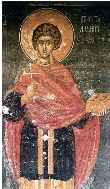
Saint Panteleimon Mont Athos, Chilandar, 1319

Troisième de saint Panteleimon, fêté le 27 juillet