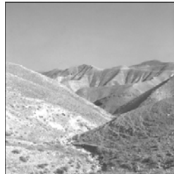
En Terre Sainte - J.V., 1968.