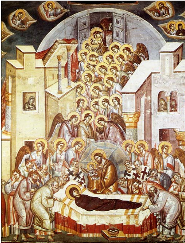
Dormition de la Mère de Dieu, Ohrid (Macédoine), fin 13e s.

Dans ton enfantement tu as gardé la virginité. Dans ta dormition tu n'as pas quitté le monde, ô Mère de Dieu. Tu as rejoint la source de la Vie, toi qui conçus le Dieu vivant et qui par tes prières délivreras nos âmes de la mort éternelle.