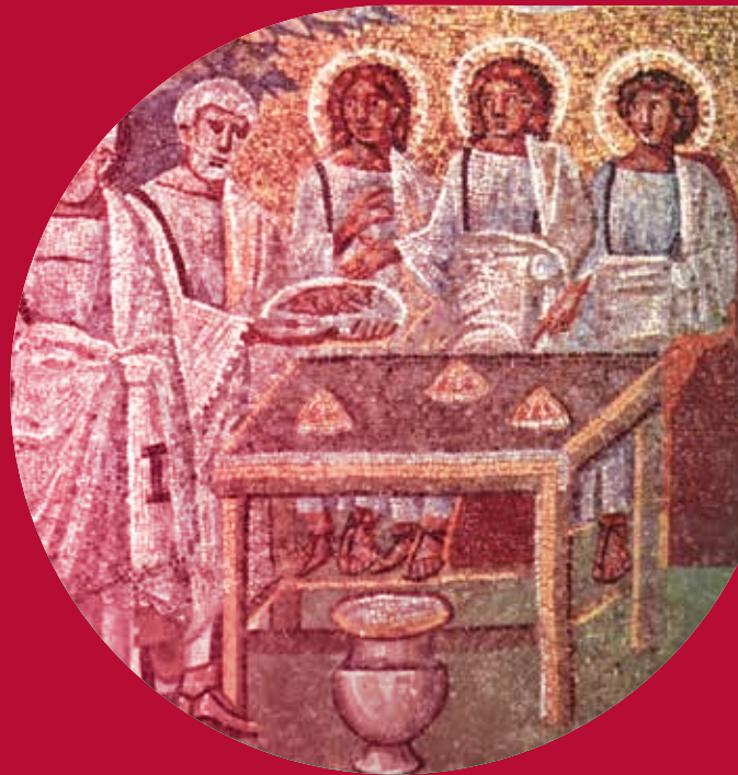
Mosaïque du Ve siècle, Sainte-Marie-Majeure, Rome