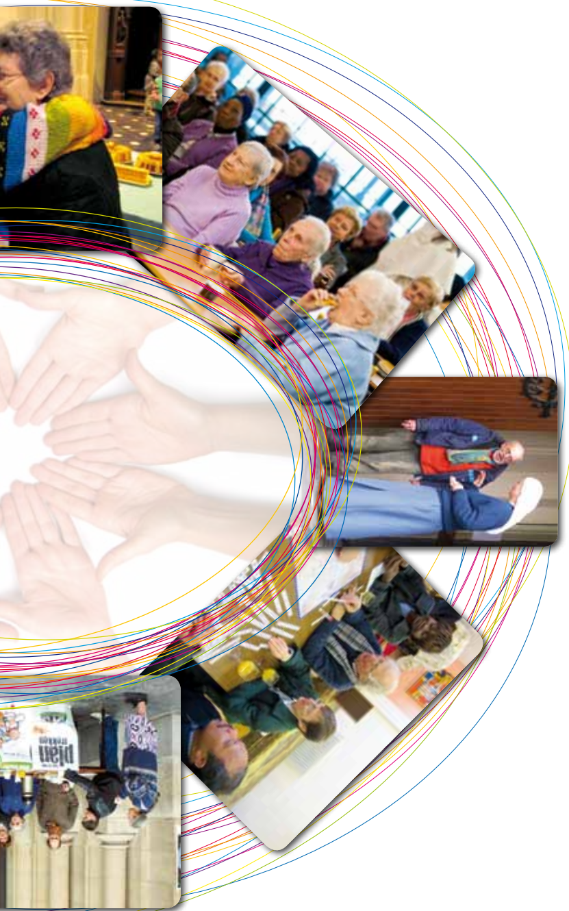
Boodschap voor de Vastentijd, 2013 Benedictus XVI

Een christelijk leven bestaat erin voortdu- rend de berg te beklimmen om God te ont- moeten en dan weer naar be- reden te komen, de uit Hem geputte liefde en de kracht dragend om onze broeders en zusters met Gods eigen liefde te dienen. In de kerk moeten contem- platie en activiteit, in zekere zin gesympoliseerd door de figuren van Maria en Martha uit het evangelie, altijd naast elkaar bestaan en elkaar aan- vullen.