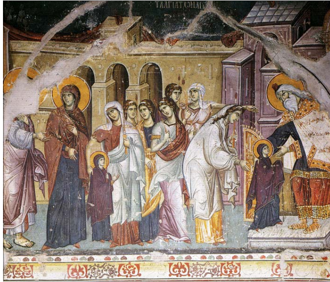
Entrée de la M.D. au Temple, Mt Athos, ca 1290