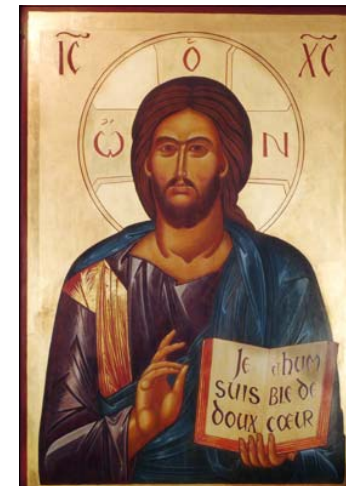
Christ enseignant - Monastère du Ricardès (France), 20è s

Amis, vous êtes l'icône de Dieu, Son manifeste, son image, sa vision. Le rôle de l'icône est de laisser deviner Celui que l'on ne peut toucher, De susciter le désir de le connaître, de transfigurer le réel Et de placer en son milieu l'étonnante lumière du Tout Autre.