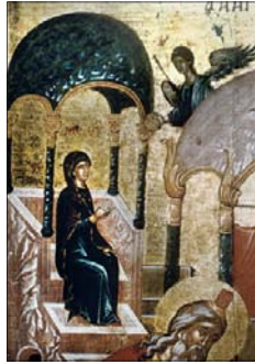
Marie au Temple, nourrie par un ange. Grèce, 15 e s.

tissé le corps humain de Jésus, et nous savons que la pourpre peut être comprise dans la Bible évoquant le sang (cf. Is 63,1-3). En même temps, au moment où Jésus remit l'Esprit (Jn 19,30), ce voile se déchira de haut en bas (Mt 27,51 et parallèles), signifiant par là même que l'être humain avait désormais accès au Saint des Saints , c'est-à-dire (pour reprendre les paroles de Jn 1,12 et 1 Jn 3,1-2) que nous sommes devenus enfants de Dieu . Par là même, Marie qui a porté dans son sein celui que l'univers ne peut contenir , comme le dit la liturgie byzantine, a tissé dans son sein celui qui unit en sa personne la divinité et l'humanité, le Verbe de Dieu — c'est-à-dire la Parole d'amour que Dieu a dite à l'humanité, une Parole qui est tellement réelle qu'elle est une personne, Jésus-Christ, lequel par sa mort librement assumée a ouvert à l'humanité l'accès au Saint des Saints, c'est-à-dire à la Vie Divine. Ce qu'Il a d'ailleurs exprimé sacramentellement en nous donnant son Corps et son Sang que nous recevons en communion. La consécration totale de Marie à Dieu est donc l'étape nécessaire pour que Dieu puisse s'incarner, nous rejoindre dans notre condition humaine, afin de nous sauver.