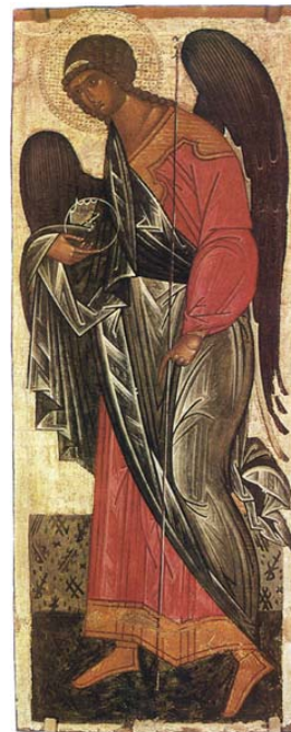
Archange Michael, Archange Gabriel, St Pétersbourg, Musée Russe, 15e s

La Fraternité des douze Apôtres célèbre la Divine Liturgie (messe, de rite byzantin, en langue française) tous les samedis à 18h00 à "Cana" (rue Eggericx, 16 - Woluwé-St-Pierre) sauf en juillet et août et exception annoncée à l'agenda.